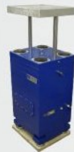
Ударные испытательные стенды