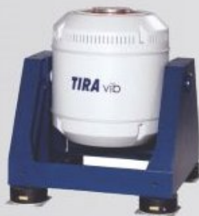
Вибрационные испытательные комплексы