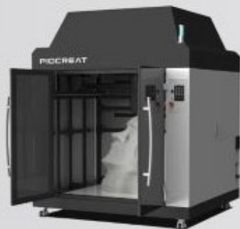
Аддитивные технологии на базе 3D-принтеров