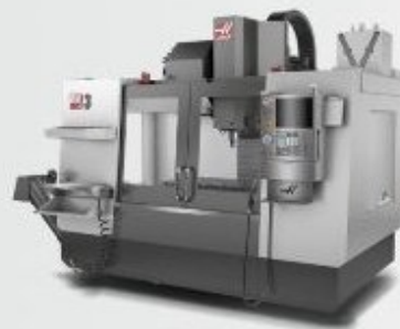
Станочное оборудование различных видов